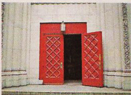
■趙曦儀以強烈的色彩對比，創作出以門口為題的照片〈Open Doors〉