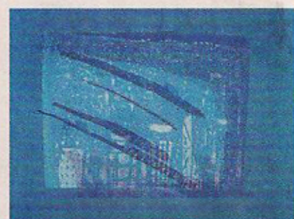
■劉掬色用藝術描出城市的空氣