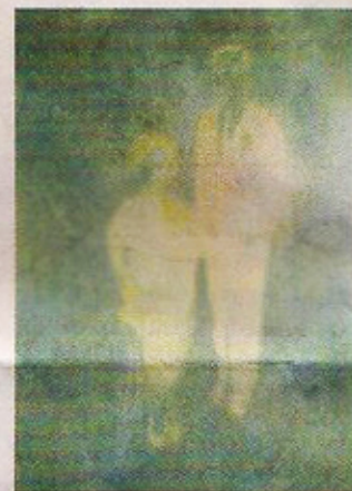
■洗朗兒找到了和歷史、前人溝通的方法，就是通過繪畫上一代的臉孔而切入當時的年代。