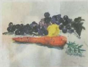
李父留下唯一的水彩畫。