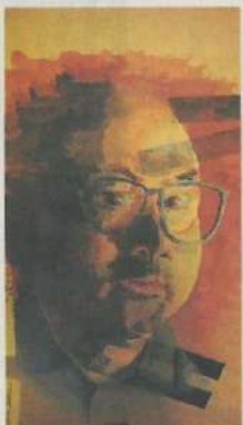
做功課時的自畫像，他說畫了十多二十張，他笑說：「個個都想畫到自己靚仔啲嘅！」

他的作品多元，有畫作，有用紙皮製作的作品，也有一些裝置藝術，數量若干，他粗略估計有數百幅。「藝術不應限制於形式，有些講求意念，創作天地是無垠。」