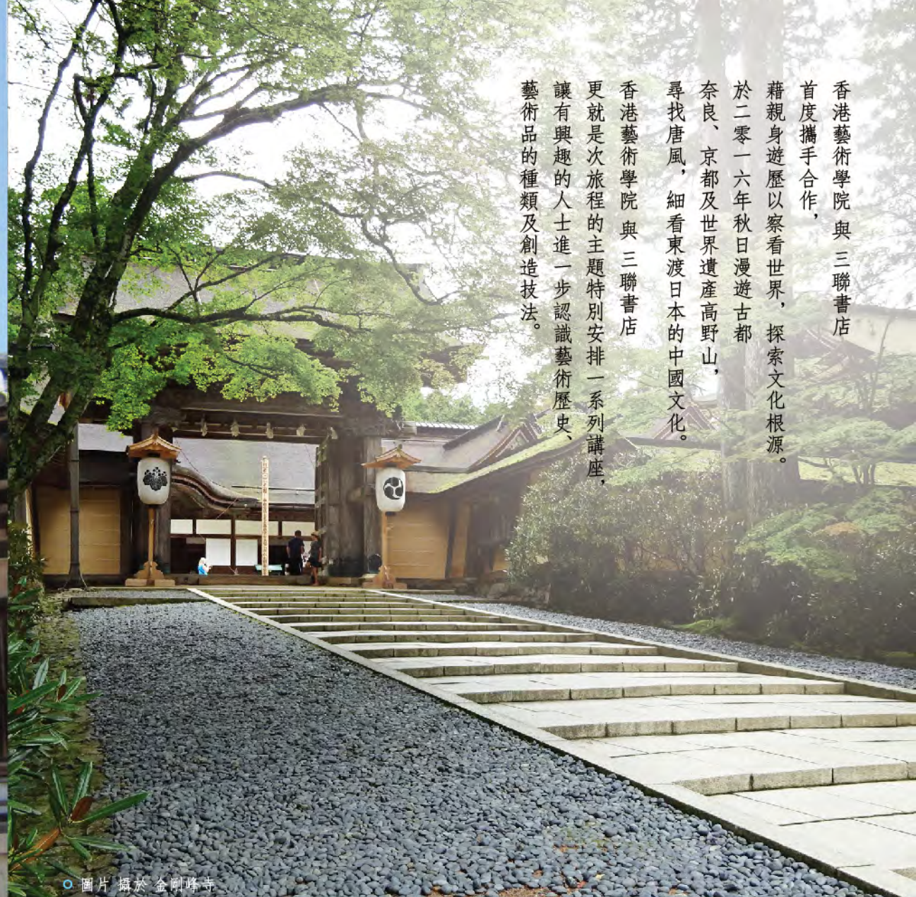
○ 圖片攝於金剛路寺

香港藝術學院與三聯書店 首度攜手合作， 藉親身遊歷以察看世界，探索文化根源。 於二零一六年秋日漫遊古都 奈良、京都及世界遺產高野山， 尋找唐風，細看東渡日本的中國文化。 香港藝術學院與三聯書店 更就是次旅程的主題特別安排一系列講座， 讓有興趣的人士進一步認識藝術歷史， 藝術品的種類及創造技法。